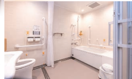
ハンディキャップ ルーム