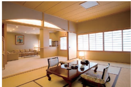
特別室(和室)【翠峰館】