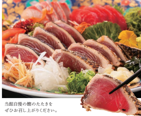
当館自慢の鰹のたたきを ぜひお召し上がりください。