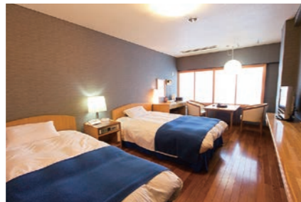
洋室ツイン【翠峰館】