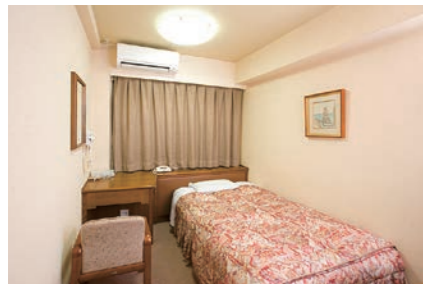
洋室シングル【翠松館】