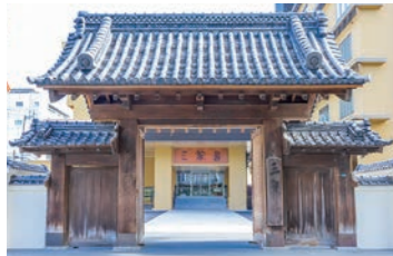
大門 土佐藩15代藩主山内容堂公下屋敷跡に建つ三翠園。風格あるどっしりとした大門は幕末の情趣を伝えてくれます。