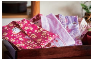
色浴衣もご用意しております。