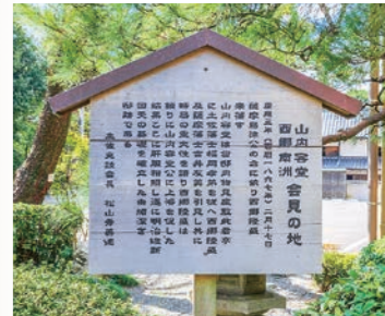
「物見亭」で重要な会見をした容堂公と西郷隆盛。歴史の転換期をしのぶ立札。

かつて、お庭に「物見亭」あり。 大政奉還を翌年に控えた慶応三年、二月十七日。 訪れたのは、薩摩藩主島津久光公のお使者、西郷隆盛。 目通ったのは山内容堂公。 鯨海酔候を自称したお殿様、 その夜の祝杯、いかばかりか。