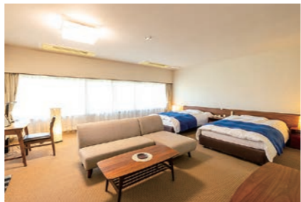
特別室(洋室)【翠峰館】