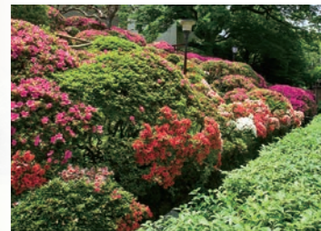
各地の大名から贈られた皞月 見頃／5月中旬～下旬