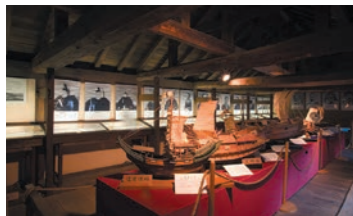
山内家下屋敷長屋資料館 二階建ての遺構は全国的にも珍しい国の重要文化財。ホテル敷地内にあり、自由に見学できます。AM7:00～PM5:00(無料)

客人を迎える大門、重要文化財旧山内家下屋敷長屋など、敷地内には幕末の香りを今に伝える歴史的建造物が佇みます。